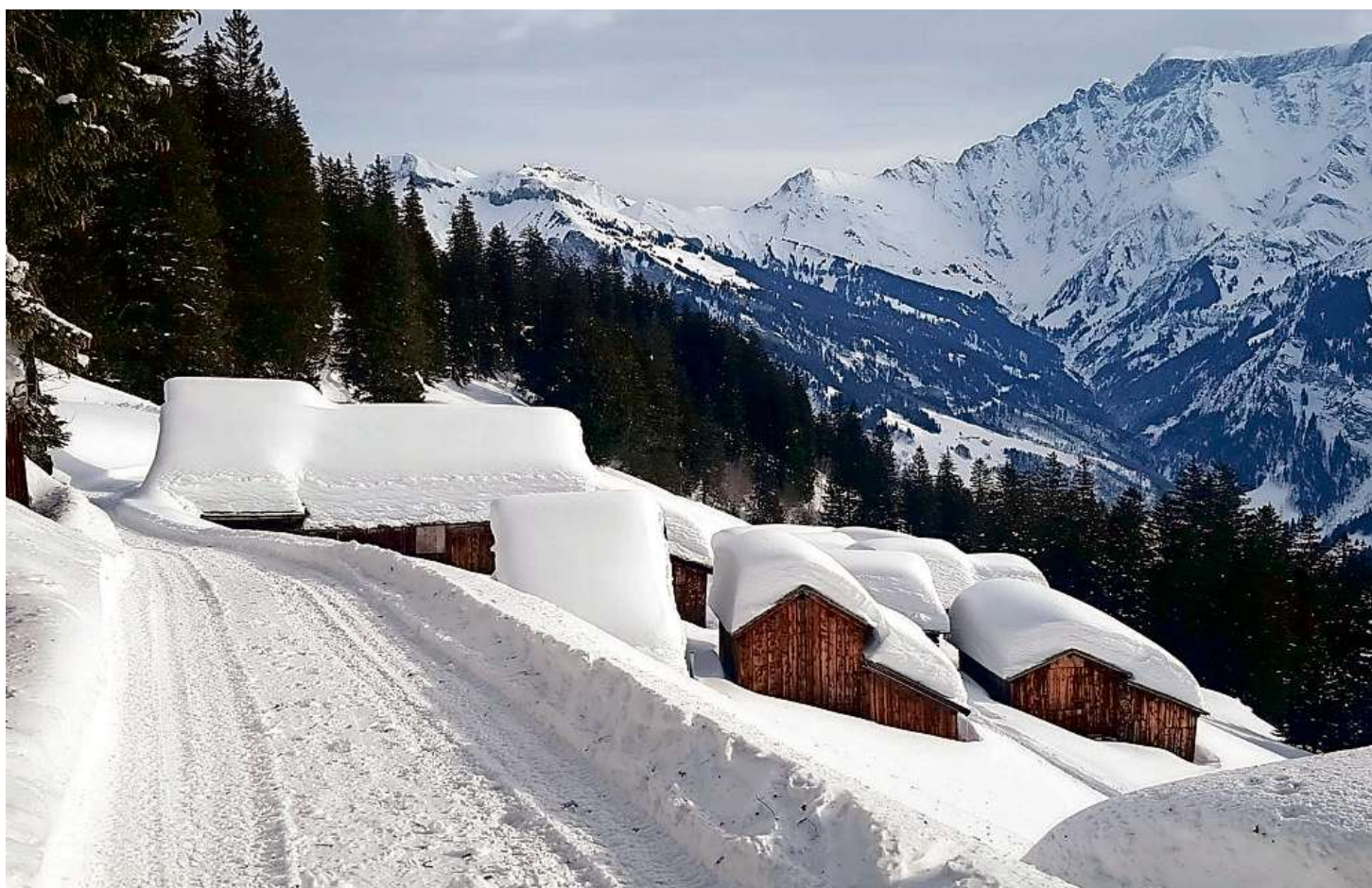
Ein erweiterter Winterwanderweg soll das Skigebiet Elm attraktiver machen.

Den Winterwanderweg vom Hengstboden bis zum Hinter-Ämpächli werden auch in die-